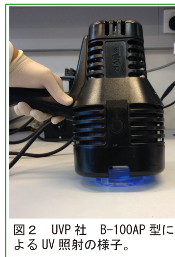
図 2 UVP 社 B-100AP 型による UV 照射の様子。