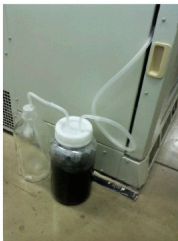
図 2: 実際の培養の様子。A. エアインキュベーター内に設置したカルチャーバッグ(写真撮影のため振とうを停止し、エアインキュベーターの前扉を開放)、B. 排気洗浄用ビンと最終トラップ用ビン。

第 3 日~第 6 日 24 時間おきに給気ならびに振とうを停止し、給気用ポンプならびにガス洗浄ビンからカルチャーバッグを切り離す。クリーンベンチ内でメタノールを最終濃度 0.5% になるように添加すると共に、必要に応じて滅菌済ピペットを用いて SDS-PAGE 分析等による目的蛋白質の発現量をチェックするためのサンプリングを行なう。図 3 に培養上清試料の SDS-PAGE 分析により、同一の培地を用いて 3L 容量のバッフル付フラスコ内で 500mL の BMMY 培地を用いて行なった場合との発現レベルの比較を行なった例を示す。