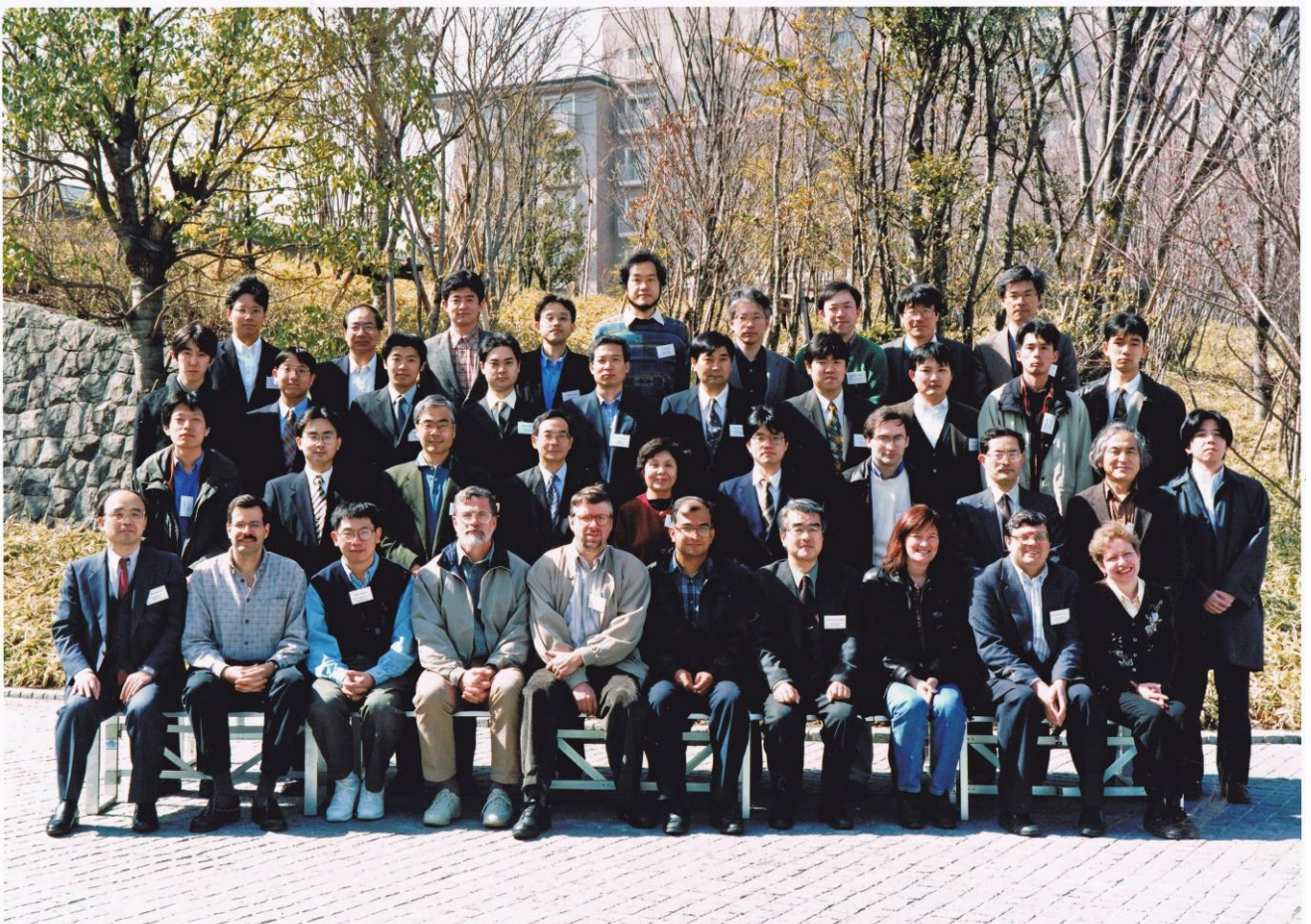
THE 24th TANIGUCHI INTERNATIONAL SYMPOSIUM