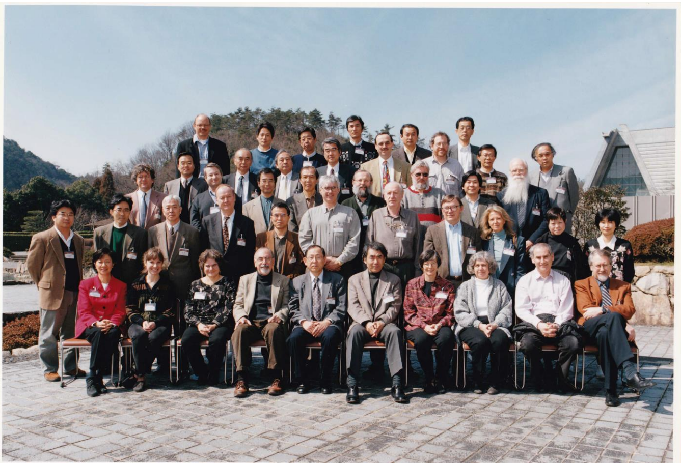
International Conference on DYNAMICS and REGULATION of the STRESS RESPONSE March 9 - 12, 1998 Kyoto, Japan

第2回のPRICPSの國際會議は、2008年6月22日-28日にオーストラリアのケアンズ(Cairns)で4th Asian and Oceanian Human Proteome Organisation Congressとのジョイントという形で開催された。第2回PRICPSの會議會期中の委員會で、PRICPSの名称をAsia Pacific Protein Association (APPA)に変更することが決められ、國際會議の開催頻度も4年毎ではなく3年毎に短縮された。阪大・蛋白研の後