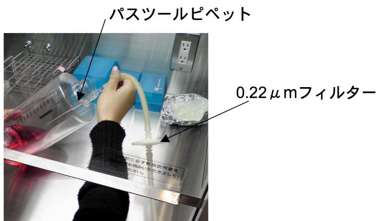
図2 : ローラーボトルへの N_2 の充填

作業はクリーンベンチ内で行い、チューブの間に0.22 \mu mのフィルターをつないで先端にはパストゥールピペットを取り付けている。各実験ごとにパストゥールピペットを付け替えればコンタミは防げる。培養液面が軽く凹む程度の圧力で N_2 を5秒ほど充填し、すぐにフタをして密閉する。